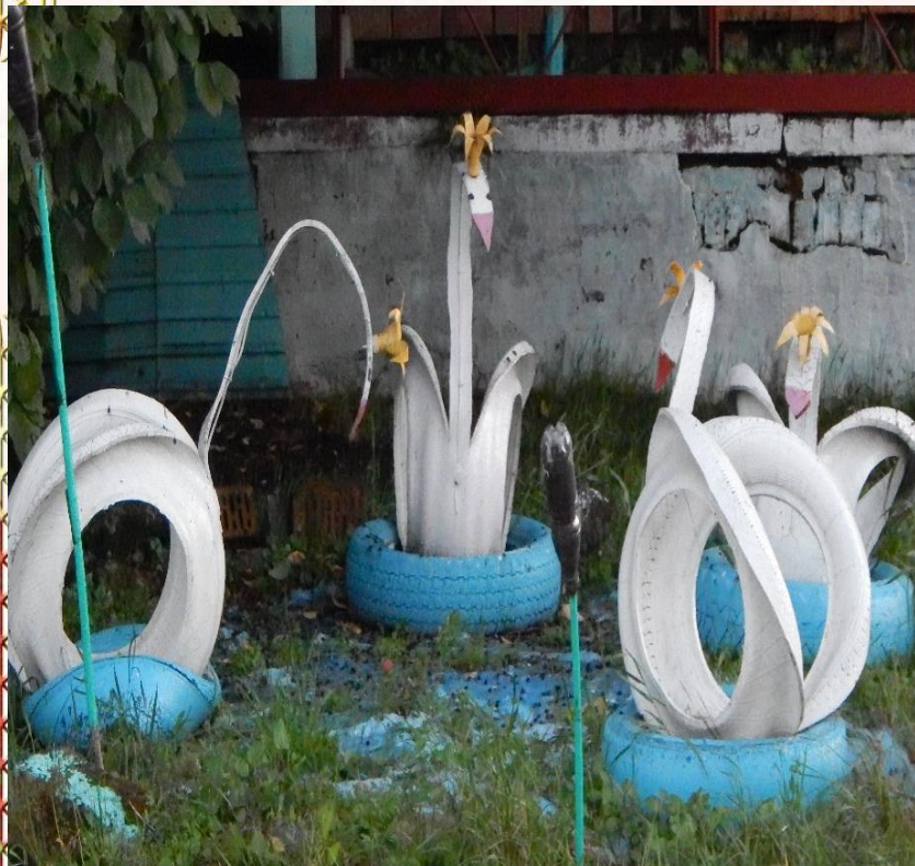
Участок на данный момент