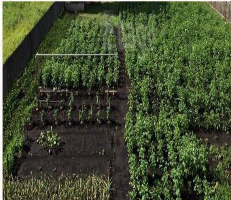
Участок на данный момент