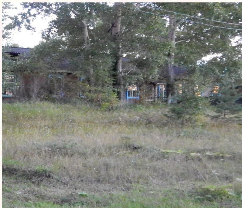
Участок на данный момент