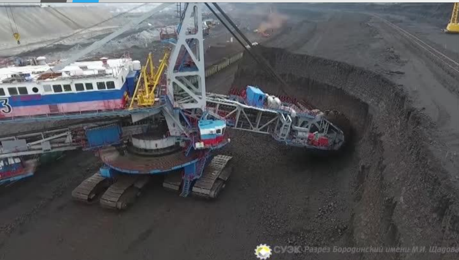
СУЭК Разрез Бородинский имени М.И. Щадова