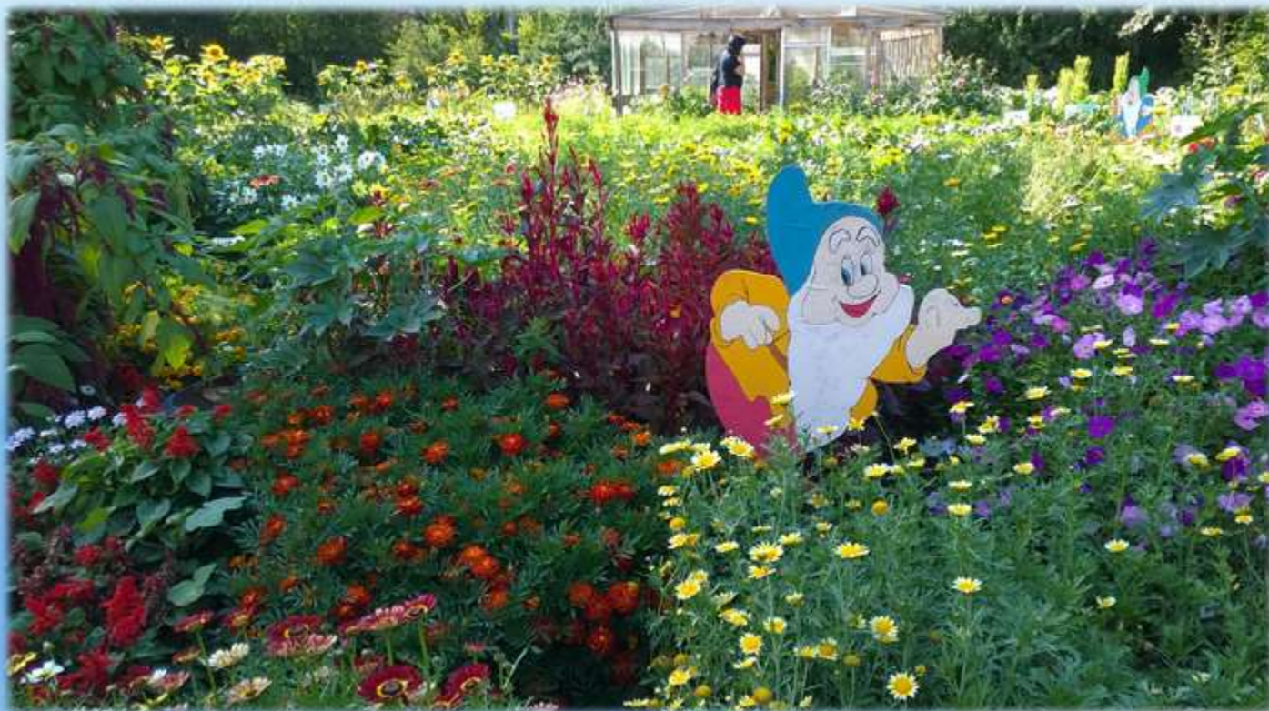
Учебно-опытный участок Боханской СОШ № 2