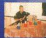
Выпуск программы включенности со средой