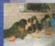
Студенты учатся писать резюме