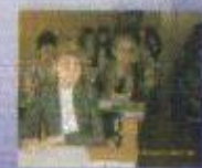
Дифференцированный обмен по профессиональному самоопределению