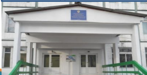
ГБПОУ ИО БПК им. Д. Банзарова