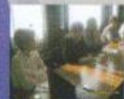
Брифинговый обмен по профессиональному самоопределению