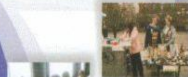
Не думай профессий