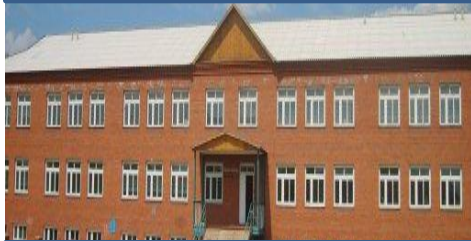
МБОУ «Ново-Идинская СОШ»