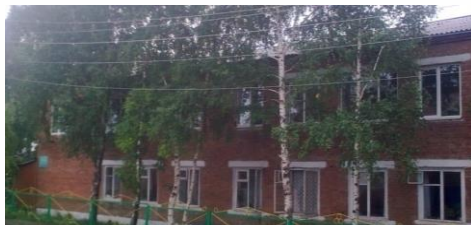
МБДОУ «Боханский детский сад №2»

Муниципальная система сопровождения профессионального самоопределения детей и молодежи на разных возрастных этапах в условиях непрерывности образования на основе межведомственного взаимодействия с учетом социально-экономического развития и этнокультурного наследия МО «Боханский район»