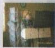
Презентация проектов по профессиональному самоопределению