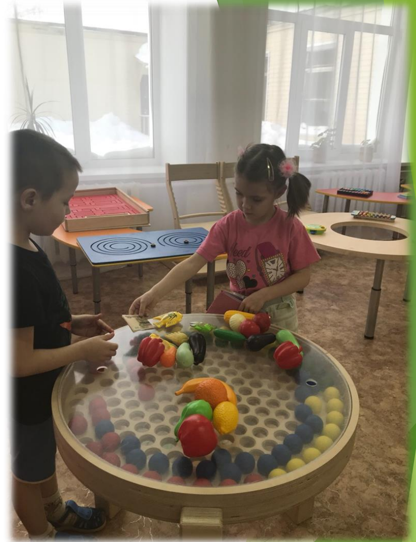
Занятия с детьми в одном из социальных учреждений