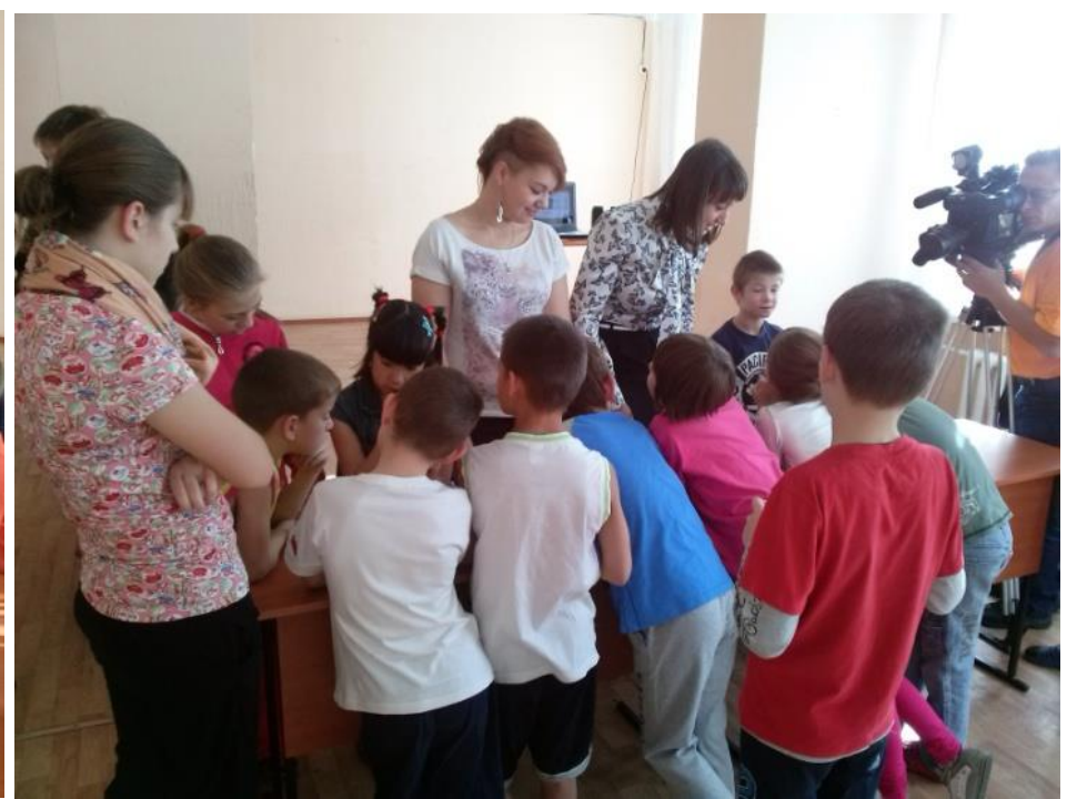
Игры, направленные на развитие креативности мышления, для детей 1- 5 классов