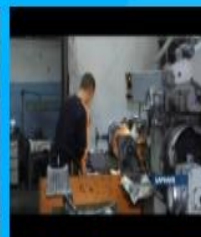
Я в рабочие пошёл