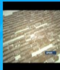
Работа в шоколаде