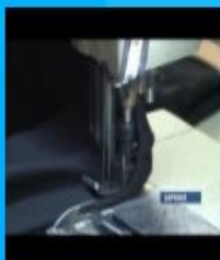
Шить не запретишь