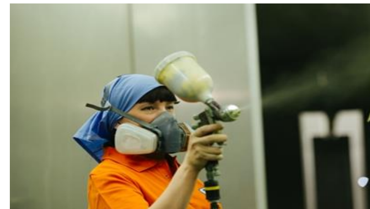
Обработанные партии деталей по цеху 34 на одного работника

Подготовлены 4 специалиста (ИТР) – 3 из них повышены в должности.