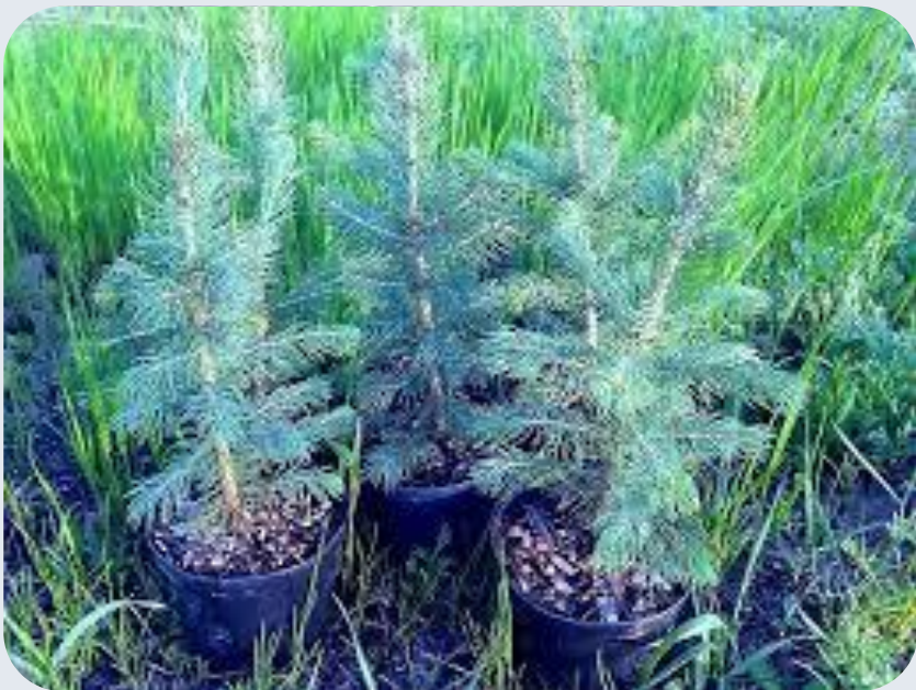
Ель голубая (серебристая)