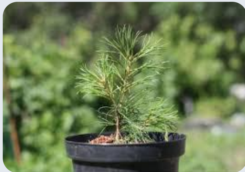
Кедр (сосна сибирская)